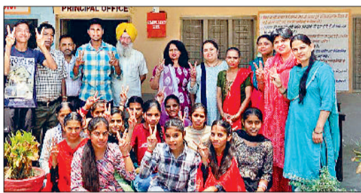
बराड़ा। परीक्षा में शानदार प्रदर्शन करने वाले स्टूडेंट्स स्टाफ के साथ।

बराड़ा। राजकीय वरिष्ठ माध्यमिक विद्यालय धनौरा का 12 वीं का परीक्षा परिणाम शानदार रहा। कक्षा 12वीं का परीक्षा परिणाम 100% प्रतिशत रहा इसमें 5 विद्यार्थियों ने मेरिट और 13 विद्यार्थियों ने फर्स्ट डिवीजन प्राप्त की।