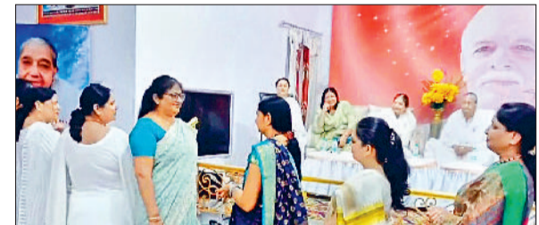
अंबाला। मातृ दिवस पर आयोजित कार्यक्रम में हिस्सा लेती महिलाएं।