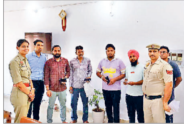
तलाश के बाद गुम मोबाइल लोगों को सौंपते हुए पुलिस अधिकारी।

साइबर सेल की टीम ने माह अप्रैल 2024 के लगभग 7 लाख 23 हजार 742 रुपये के गुमशुदा 41 मोबाइल फोन तलाशकर उनके मालिकों को लौटाने का कार्य किया है। पुलिस अधीक्षक नवीन सिंह रंधावा ने बताया कि गु म शु दा मोबाइल फोन त ला श क र उनके मालिकों को लौटाने के लिए विशेष अ भि या न चलाया जा रहा है। इससे आम नागरिकों को आर्थिक क्षति से बचाया जा सके। इस अभियान के दौरान साइबर सेल अंबाला की टीम ने माह अप्रैल 2024 में लगभग 7 लाख 23 हजार 742 रुपये के